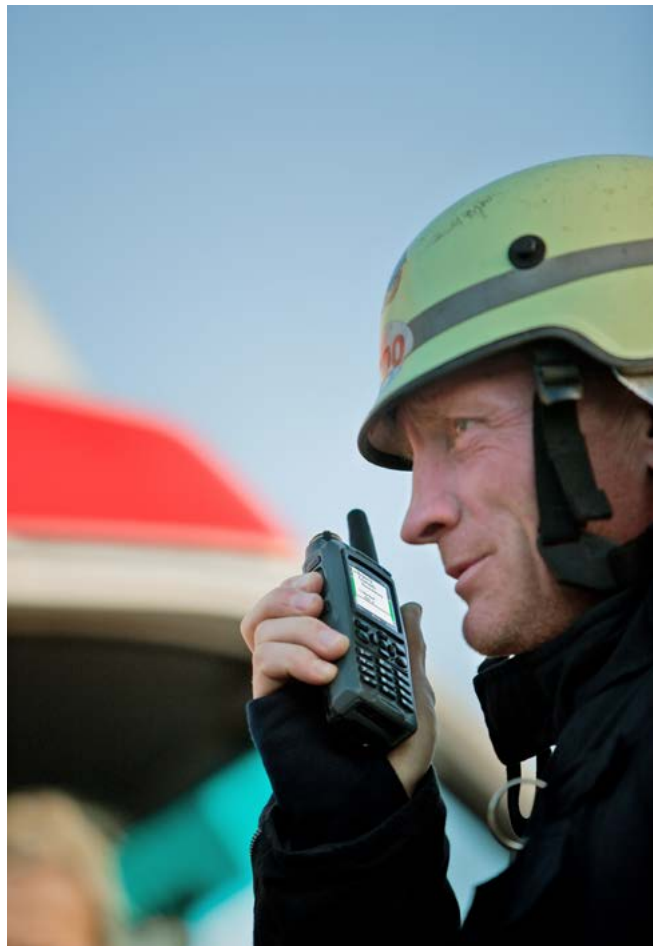
Sirenensteuerung benötigt nur minimale Funktionen der TETRA-Funkgeräte

zu Alarmierungen als Callout Pre-Coded Status und die technischen Statusmeldungen als Standard SDS-Status versendet werden. Diese Trennung ist notwendig, da bei technischen Statusmeldungen eine Callout Number Referenz wie bei einer Alarmierung nicht vorliegen kann. Die Verwendung des SDS-Status erlaubt außerdem eine Anzeige der technischen Statusmeldungen auf jedem beliebigen vorhandenen TETRA-Statustableau - und dies unabhängig von den Rückmeldungen der Alarmierungen an die auslösende Stelle.