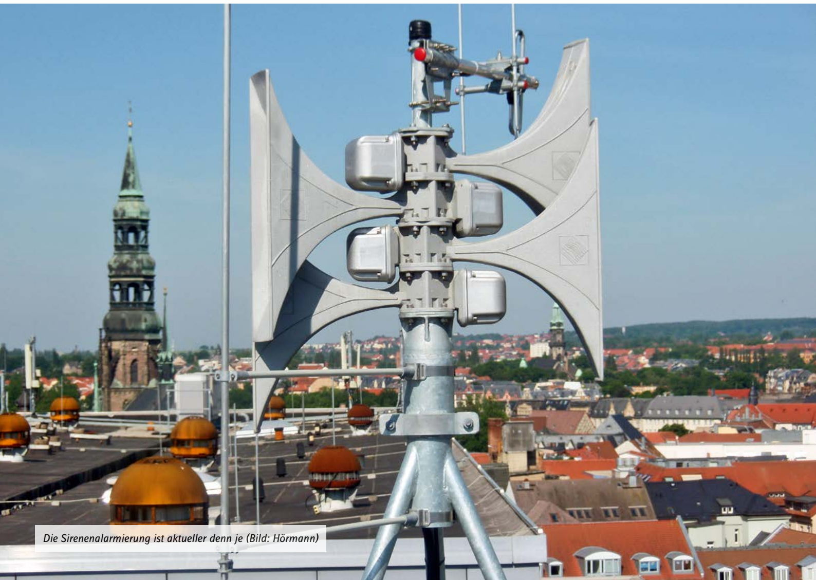
Die Sirenenalarmierung ist aktueller denn je